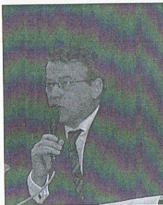
„Friede, Freiheit, Wohlstand gemeinsam erarbeiten“

wollten, sich vor allem ehrenamtlich in der Kommunalpolitik oder Jugendarbeit zu engagieren, denn so würde sich zeigen, dass man sich mit dem Willen etwas zu verändern, einmischen wolle. Nur sollte man sich nicht vormachen, dass die Politik nur aus Erfolgserlebnissen bestehe. Man müsse auch hinnehmen können, dass vieles nicht nach seinen Vorstellungen ablaufen werde. Seit 1989 ist Reimer Böge Abgeordneter im Europäischen Parlament, insgesamt hat das Parlament 736 Abgeordnete. Wie in Deutschland ist auch das europäische Parlament in Parteien gegliedert. Reimer Böge gehört der EVP an, der Fraktion der christlichen Demokraten im europäischen Parlament. Neben der EVP gibt es noch fünf weitere Parteien und fraktionslose Abgeordnete. Die Abgeordneten des Parlaments werden direkt von den Bürgern der europäischen Staaten gewählt. Es ist die einzige Institution weltweit in dieser Größenordnung, die direkt von den Bürgern gewählt werden kann. Die Europawahlen finden in diesem Jahr am 7. Juli statt. Er wünsche sich, so Reimer Böge, dass möglichst viele Menschen, vor allem auch junge, an dieser Wahl teilnehmen würden, denn die europäische Union sollte eine Union der Bürger und Staaten sein. Die letzten Wahlen hätten gezeigt, dass dies noch nicht so sehr in den Köpfen der Menschen verankert ist, darum sei es wichtig, Aufklärungsarbeit zu leisten, um zu zeigen, dass jeder Bürger mit seiner Stimme die Politik in der EU und somit